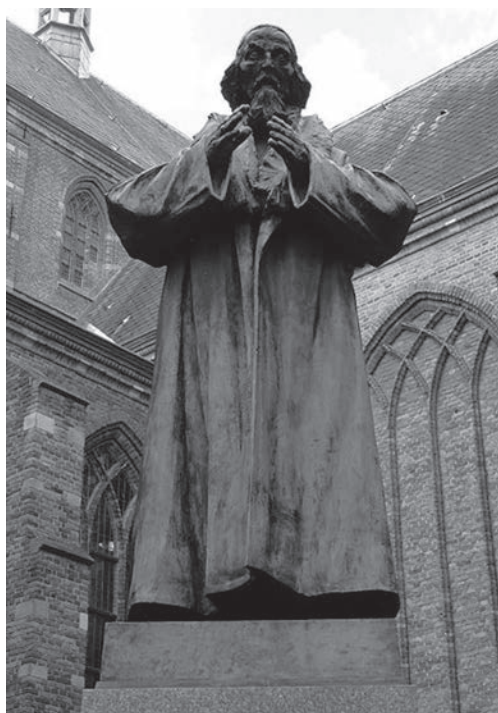
Komenského socha v nizozemském Naardenu.